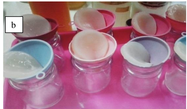
Gambar 2 (a). Produksi nata selulosa bakteri pada media Schram dan Henstrin (1954) (b). Lembar nata selulosa bakteri warna putih hingga transparan.

mengandung nutrisi, seperti sukrosa, dekstrosa, fruktosa dan vitamin B kompleks (Onifade et al. , 2003). Kandungan nutrisi diatas sangat mendukung pertumbuhan maupun aktivitas A xylinum pada saat berlangsungnya fermentasi. Pada kondisi yang sesuai bakteri A. xylinum , dapat mensintesis larutan monosakarida, disakarida dalam substrat menjadi suatu polisakarida.