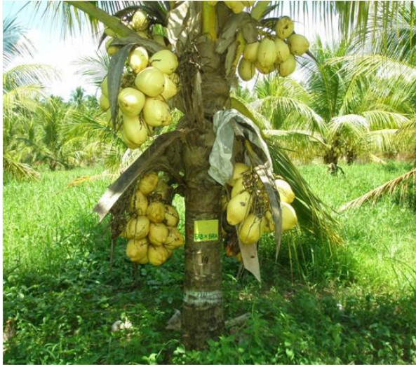
Gambar 3. Penampilan kelapa GKB umur tanaman 6 tahun