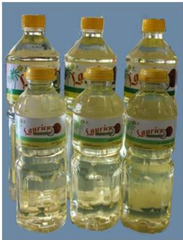
Gambar 2. Produk minyak goreng kelapa

Pengolahan cara tradisional dapat diperbaiki sehingga dihasilkan minyak kelapa berkualitas tinggi yang disebut minyak goreng sehat. Perbaikan pengolahan dilakukan pada tahap fermentasi dan pemanasan. Cara pengolahan untuk menghasilkan minyak goreng sehat merupakan modifikasi dari pengolahan minyak kelapa dengan metode pemanasan bertahap yang dilakukan oleh Lay dan Rindengan (1989). Cara pengolahannya adalah sebagai berikut: Buah kelapa dipisahkan sabutnya, dibelah dan dikeluarkan daging buahnya. Daging buah berkulit ari ( paring ) diparut dengan mesin parut kelapa. Parutan daging buah ditambah air dengan perbandingan 1:1 (b/v), lalu diperas menggunakan alat pengepres untuk mendapatkan santan. Santan dituang pada wadah plastik transparan yang dilengkapi kran pada bagian bawah. Santan kemudian didiamkan selama \pm 1-2 jam sehingga akan terbentuk lapisan skim pada bagian bawah dan krim pada bagian atas. Krim dipisahkan dari skim dengan membuka kran pada bagian bawah wadah untuk mengeluarkan skim. Krim kemudian dimasukkan dalam wadah plastik transparan lalu